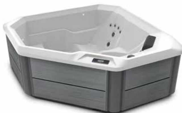
Modèle TX avec coque Blanc alpin et habillage Gris orage.